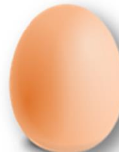
Mediano Entre 57gr. a 51,5gr.